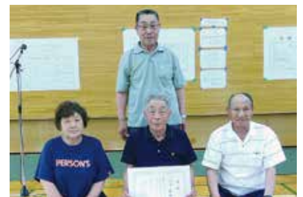
【ボッチャ優勝】車輪梅