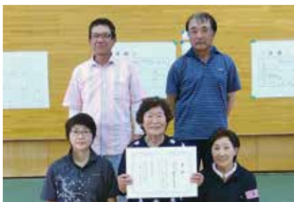
【囲碁ボール優勝】岩子しおかぜクラブ

令和6年度7月5日(金)スポーツアリーナそうまにて行われました。市内12チーム約200人が参加しました。競技種目は、スカットボール・ボッチャ・囲碁ボールの3種目です。各種目優勝者は、8月21日(水)いわき市で行われる県のニュースポーツ交流大会に出場します。県の大会に向けて皆さん気合十分でした。なかなか勝敗が決まらない種目もありましたが、チーム一丸となり交流をより一層深めることができた大会となりました。