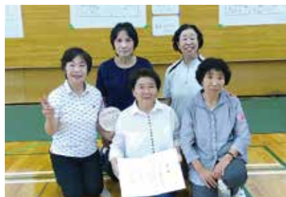
【スカットボール優勝】岩子しおかぜクラブ