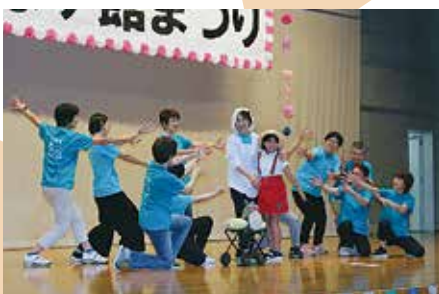
手話サークル「でんでん虫」