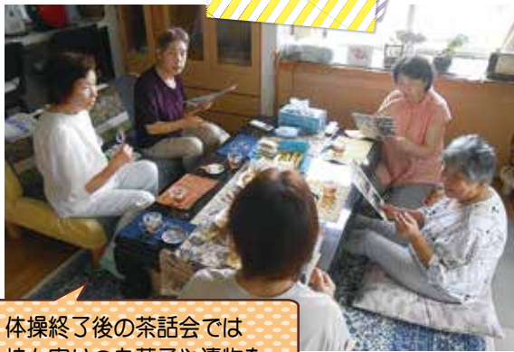
体操終了後の茶話会では持ち寄りのお菓子や漬物を食べながら大盛り上がり(^^)

現在、市内で骨太けんこう体操に取り組んでいただいている団体は61団体、673名となりました。体操をきっかけに、住民の方同士のつながりもより深くなっています！