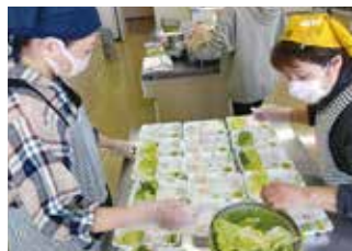
ほっとネット協力員養成講座