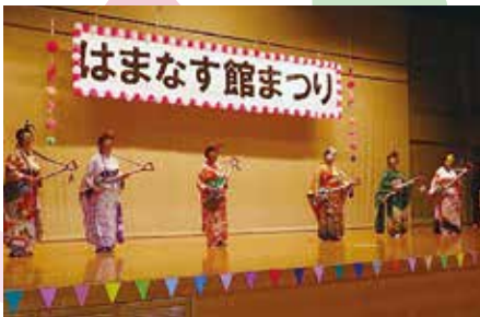
玉野公民館「スコップ三味線教室」

6団体によるステージ発表の他、大道芸人によるバルーンショーが披露され、会場を大いに盛り上げていただきました。