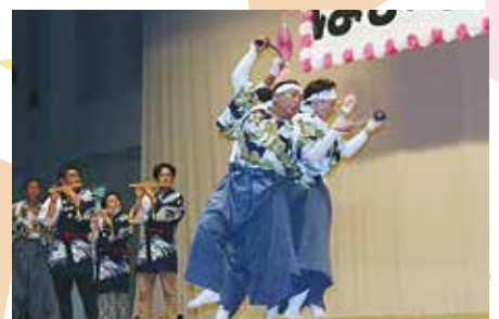
瀧神社御手神楽保存会