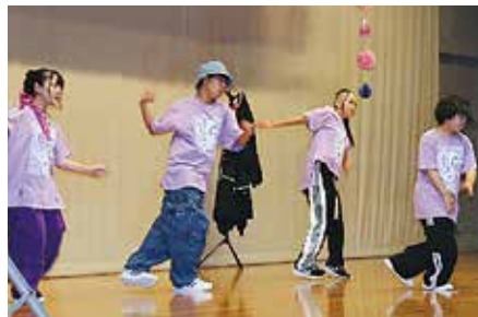
ミッキー先生のダンススクール