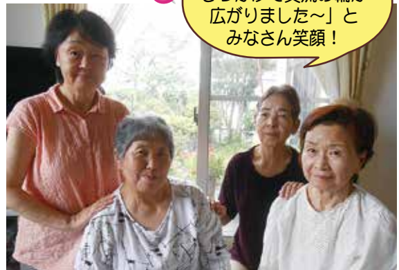
「骨太けんこう体操がきっかけで交流の輪が広がりました～」とみなさん笑顔！

東部公民館では今年度より「盆ダンス教室」がスタートしました。住民の方が先生となり、盆踊りからヒップホップダンスまで幅広く踊っているそうです。踊っている方の表情はとても明るく、楽しさがこちらにまで伝わってくるほどでした。ダンスの後には、お茶会でわいわい盛り上がっています。