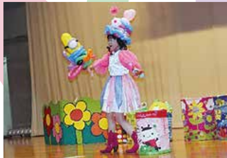
大道芸人によるバルーンショー