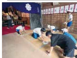
児童・生徒のボランティア活動普及事業指定