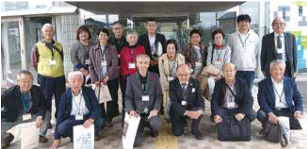
▲山形県天童市民生児童委員連絡協議会の皆様