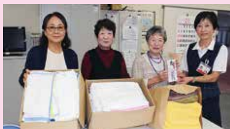
▲涼ヶ岡八幡神社敬神婦人会の皆さん