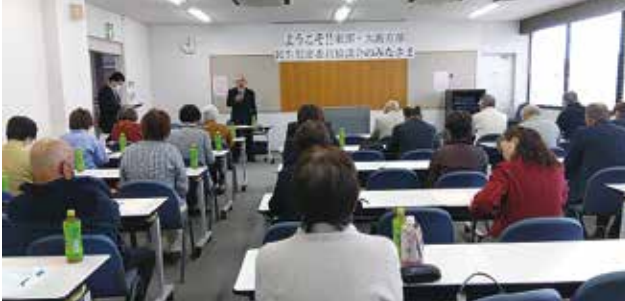
▲福島市東部・大波方部民生委員児童委員協議会の皆様

平常時の活動や災害時の対応、日々の活動の中での課題や悩み等について情報を交換することができました。