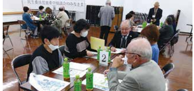
▲仙台市若林区民生児童委員協議会の皆様