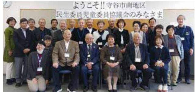
▲茨城県守谷市南地区民生委員児童委員協議会の皆様