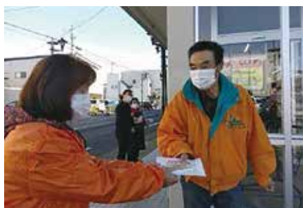
民生児童委員協議会