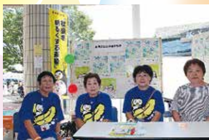
更生保護女性会のみなさん