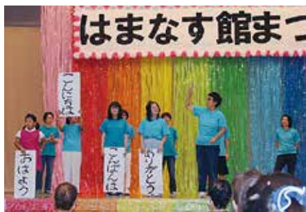
相馬手話サークル「でんでん虫」