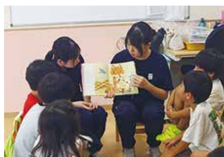
サマーボランティアスクール