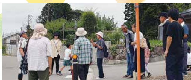
人数確認も住民自ら行います