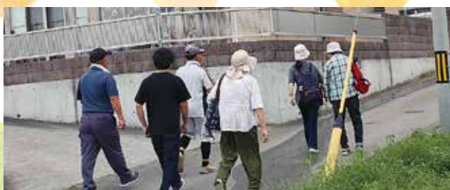
ご近所同士声をかけあって高台へ避難！

災害発生時に最も力を発揮するのが「共助」の力！近隣の方向士、助け合うことができるためには、日ごろからの顔の見える関係づくりが重要になってきます。道端での井戸端会議やゴミ出しの際のあいさつなど、日々の生活の中で、顔と名前が一致する人が増えていくだけで防災の体制は強くなっていきます。今日からできる小さな行動で、顔の見える関係を増やし、災害に強い地域をつくっていきましょう！