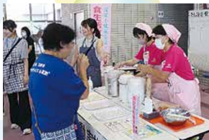
食生活改善推進員のみなさん