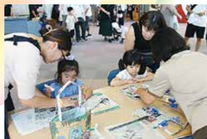
エコバック作り体験コーナー