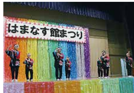
磯部公民館 舞踊教室