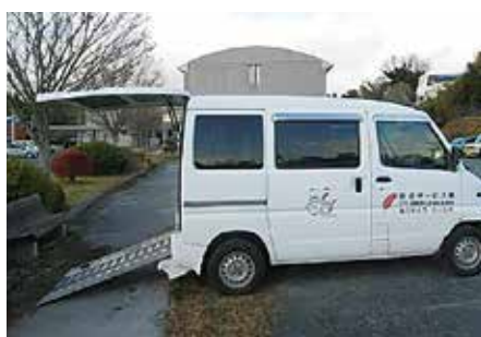
車椅子同乗軽自動車の貸出