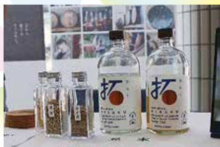
玉野アセンド蒸留所さま