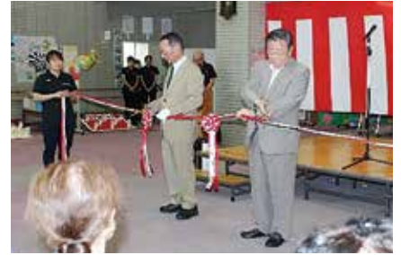
開会式でのテープカット