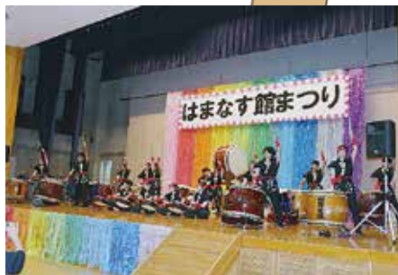
相馬高等学校 太鼓部

6団体によるステージ発表の他、大道芸人によるバルーンショーが披露され、会場を大いに盛り上げていただきました。