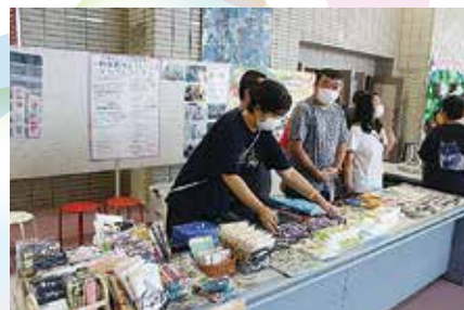
就労支援部会のみなさん