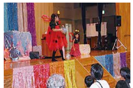
大道芸人によるバルーンショー