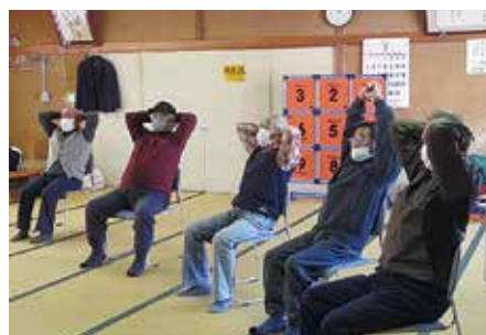
身体障がい者福祉会