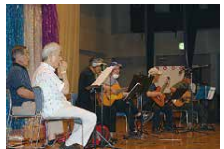
刈敷田ギター愛好会