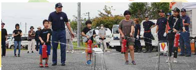
指導を受け、消火訓練を実施！

みなさんの地区にある素敵な活動、集いの場の情報をお知らせください。取材に伺いますのでご連絡お待ちしております。 問合せ：地域福祉係 ☎36-5033 羽根田まで