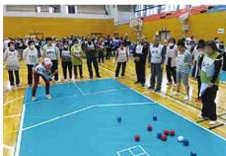
老人クラブ連合会